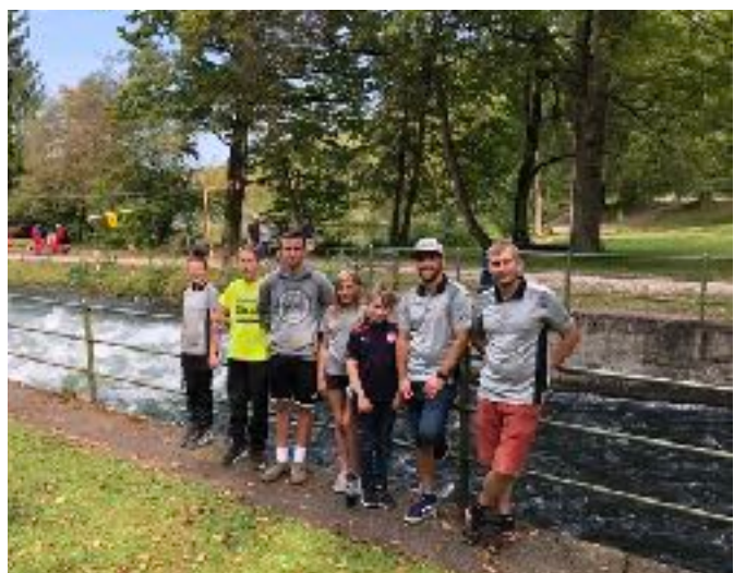
Team der Ulmer Paddler in München

Nun steht eine kurze Trainingspause an bevor wir dann am 25.10.21 in die neue Saisonvorbereitung starten!